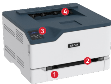
Imprimante couleur C230 de Xerox®