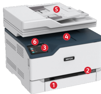
Imprimante multifonction couleur C235 de Xerox®