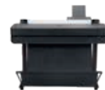
HP DesignJet T650